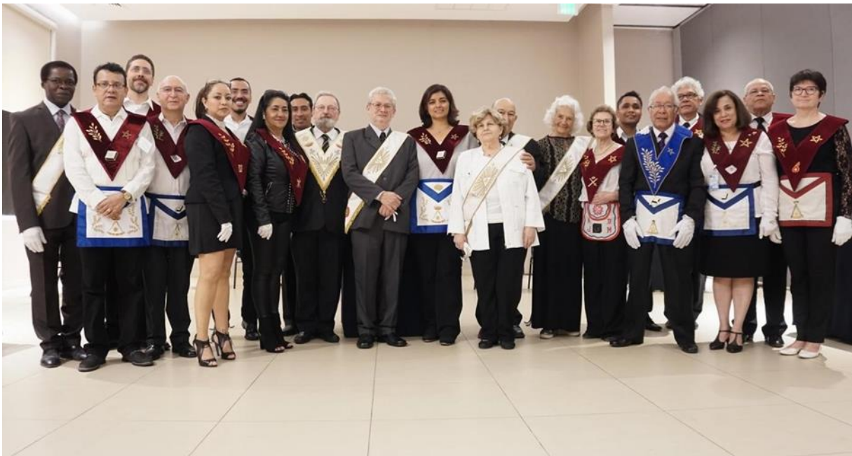
Elevação ao XIVº grau.